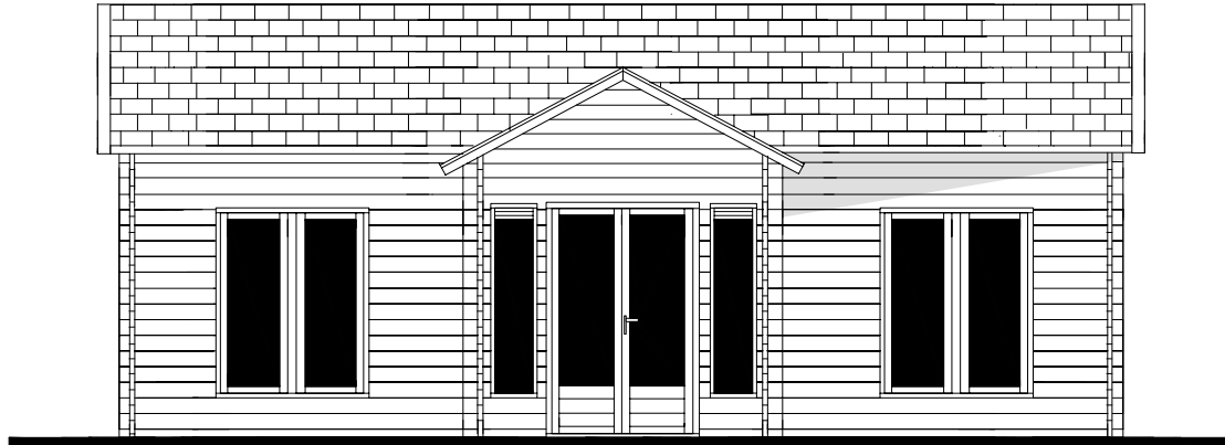
Voor aanzicht Vorder Ansicht Front view